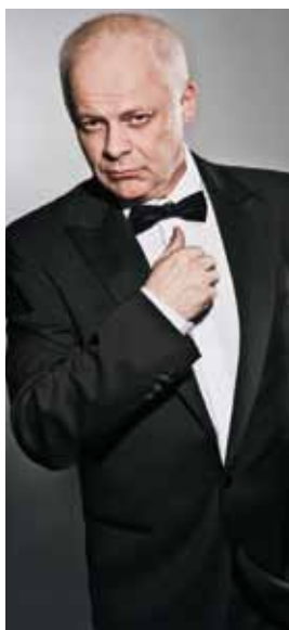
Bob Klepl 54 let, herec a pilot Helmut