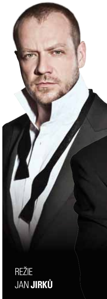
REŽIE JAN JIRKŮ

Letní scéna Vyšehrad | 25. 6.–6. 9. 2012