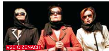
VŠE O ŽENÁCH