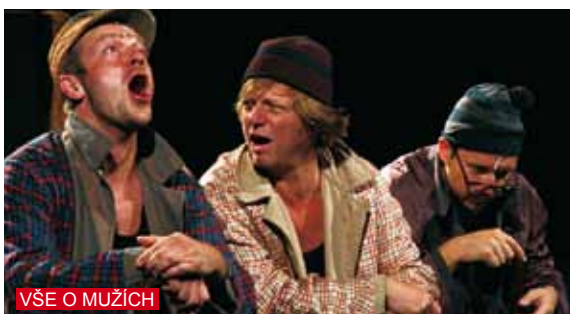
VŠE O MUŽÍCH