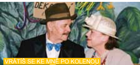
VRÁTÍŠ SE KE MNĚ PO KOLENOU