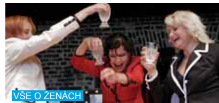
VŠE O ŽENÁCH