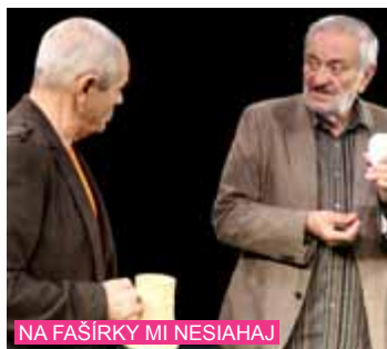
NA FAŠÍRKY MI NESIAHAJ